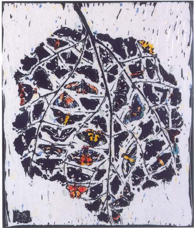
鏈 陶瓷·釉藥 78×92cm 2001.5