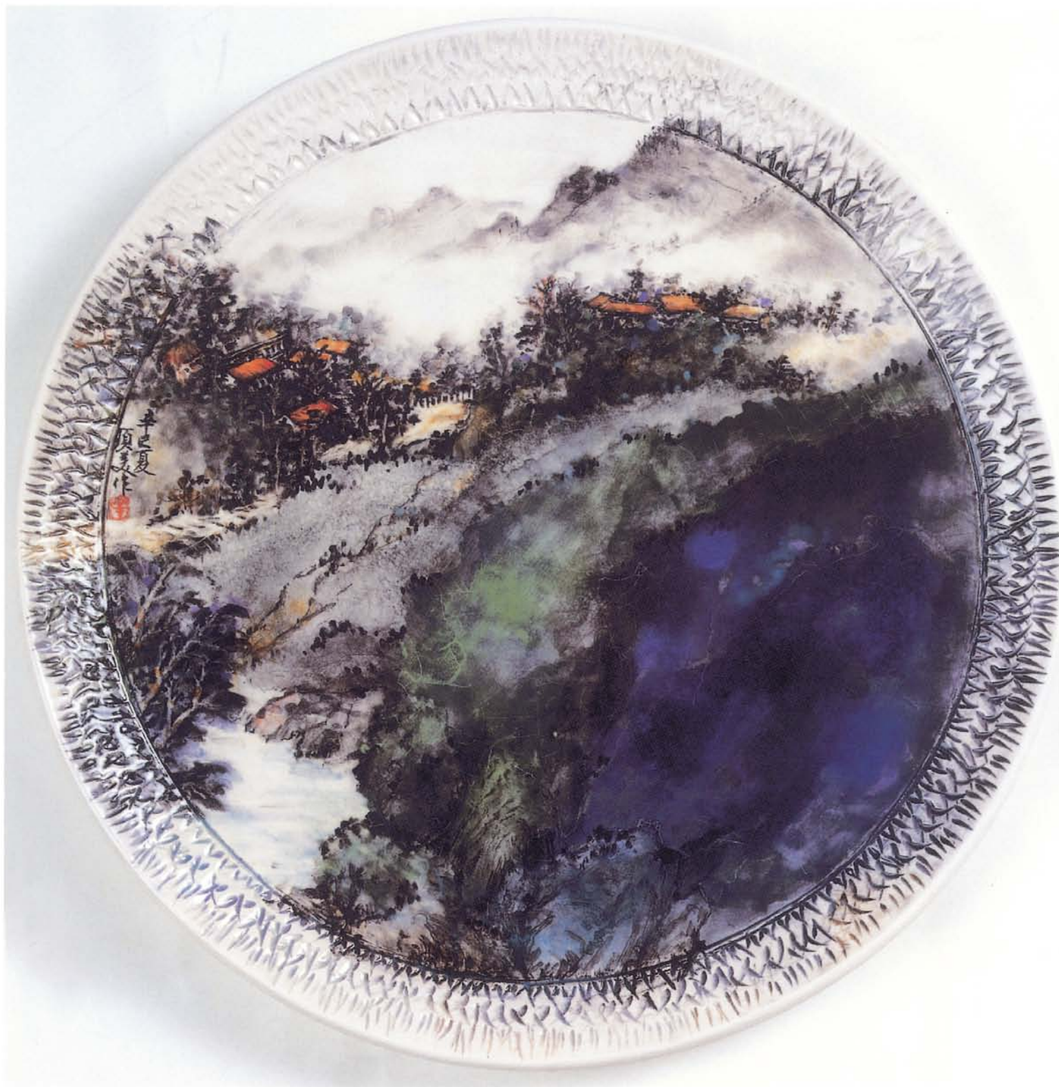
青山幽境 S26瓷土·中溫釉下彩 36×36cm瓷盤 2001