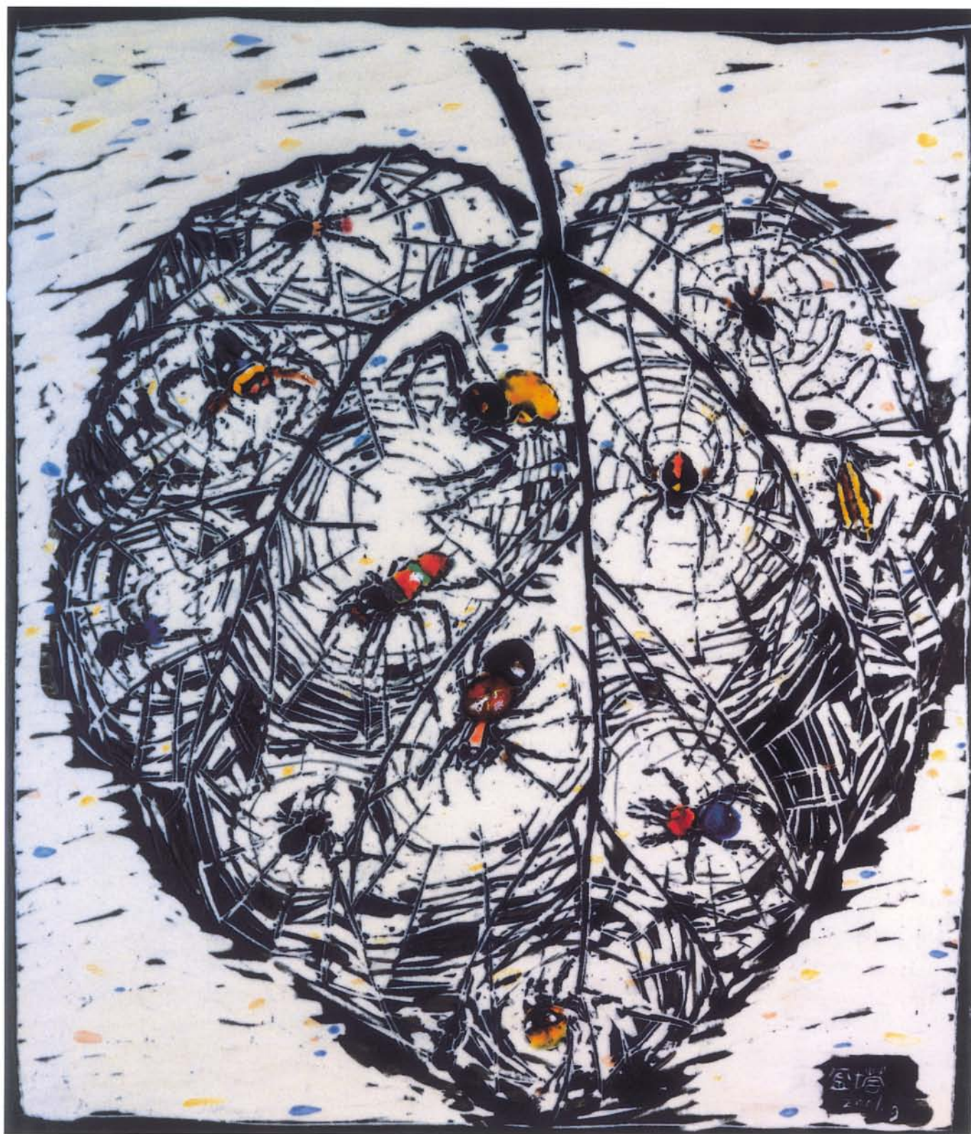
鏈 I 陶瓷·釉藥 39×46cm 2001.5