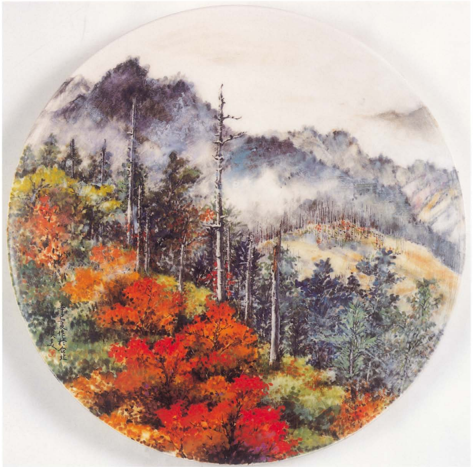
秋之曲 S26瓷土・中溫釉下彩 40×40cm瓷盤 2001