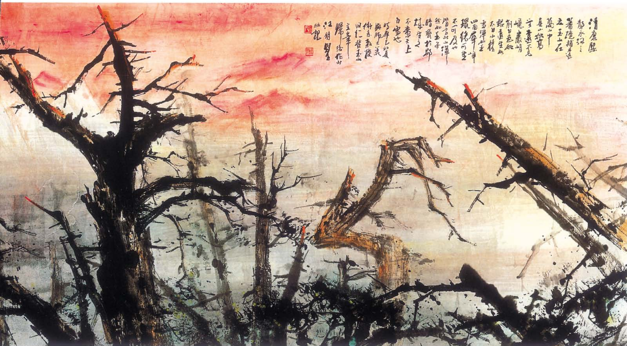
玉山遠眺 水墨賦彩 68×248cm 2001