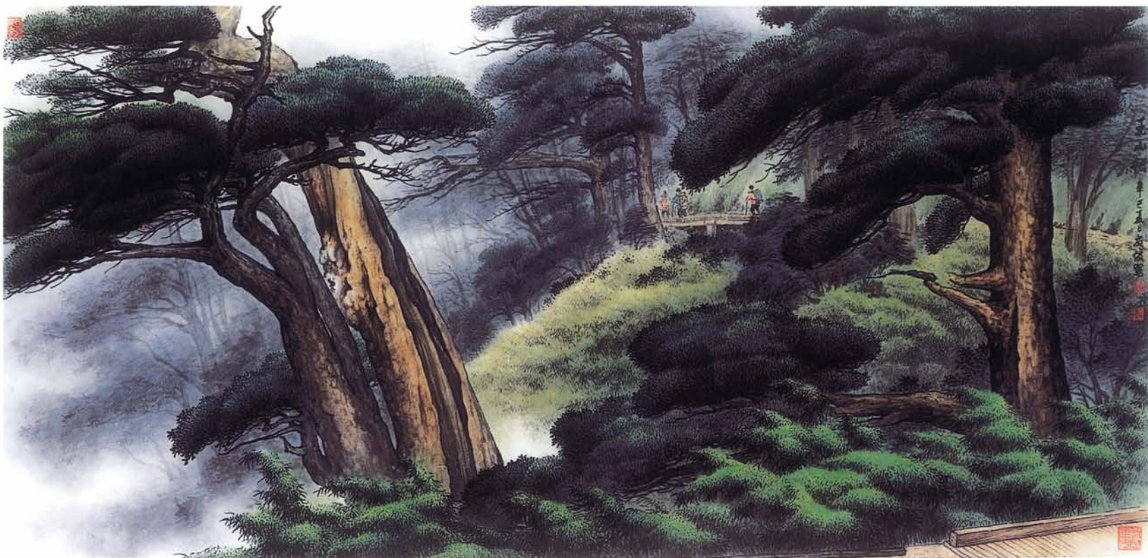
玉山行【一】 絹本水墨著色 86×174cm 2001