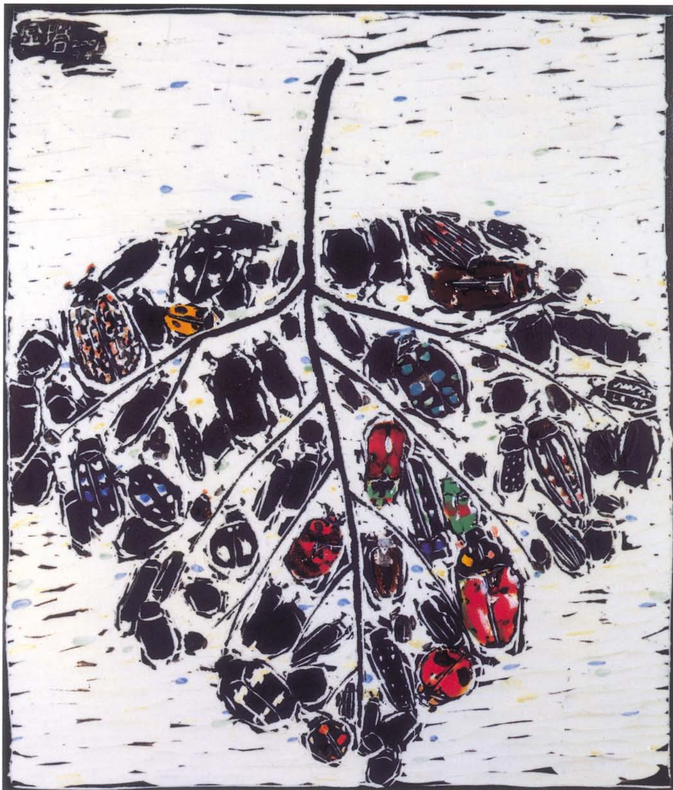
鏈II 陶瓷·釉藥 39×46cm 2001.5