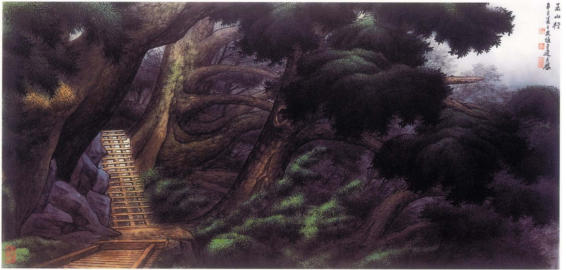
玉山行【二】 絹本水墨著色 86×174cm 2001