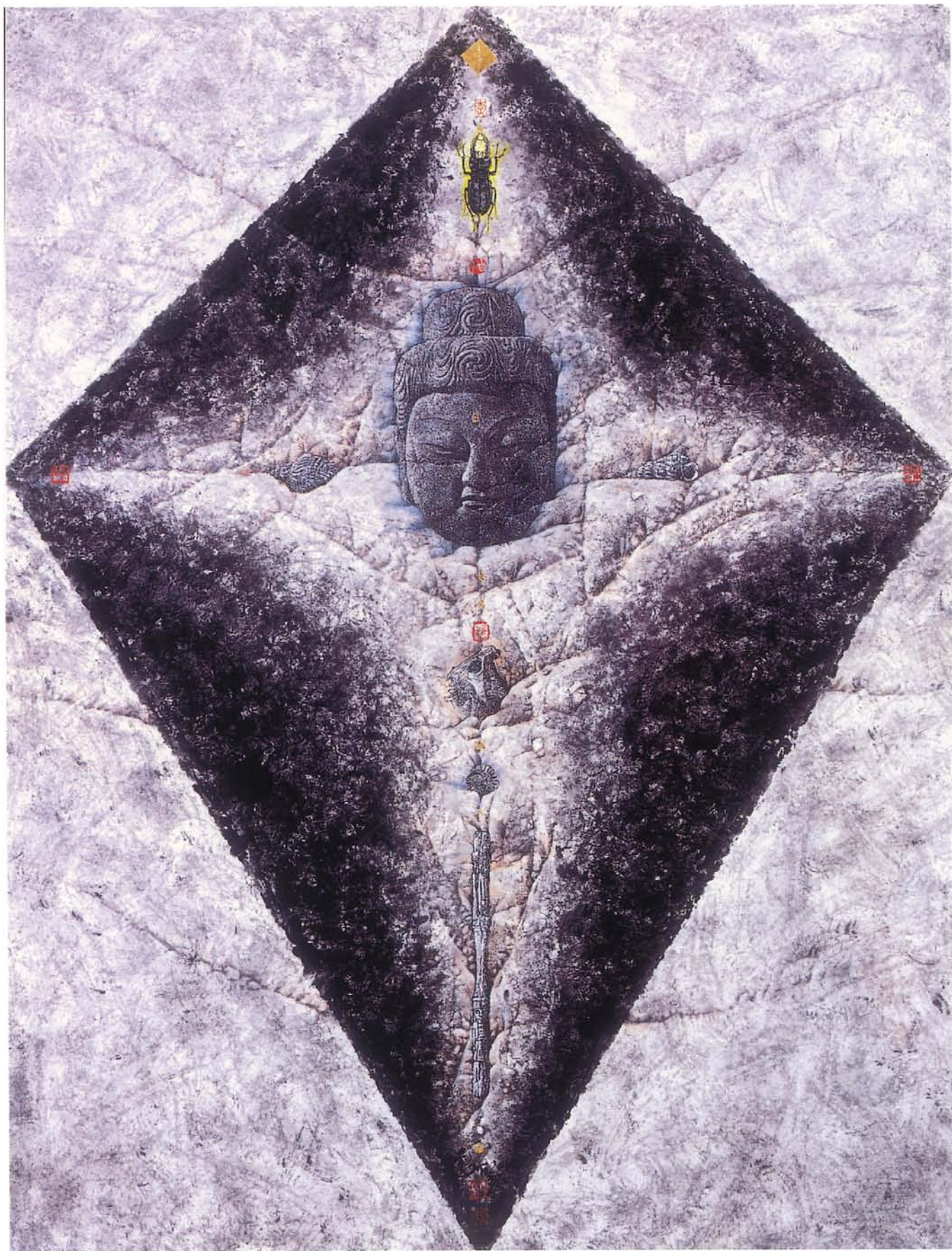
岩壁記事 水墨 128×97cm 2001