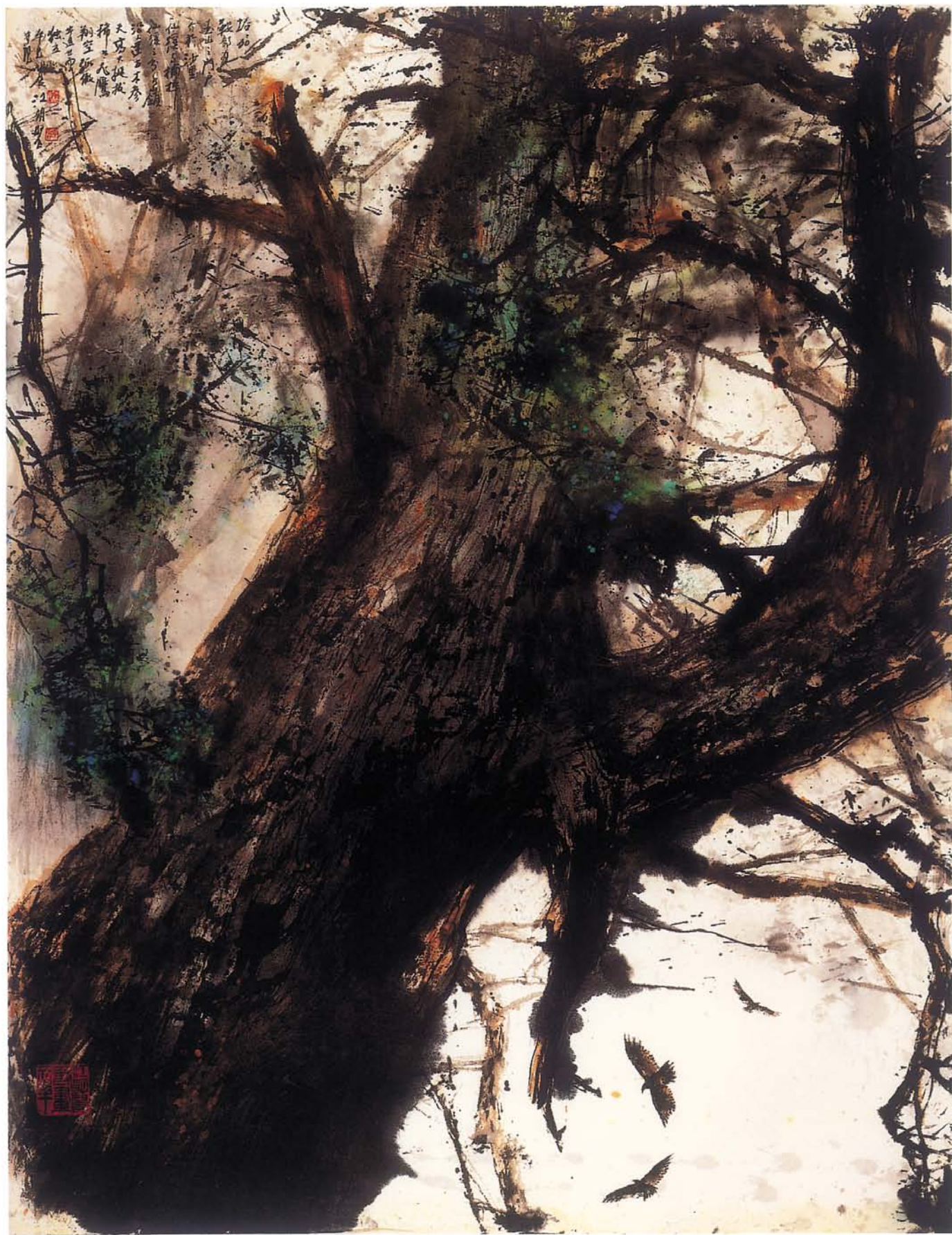
玉山神木 水墨 97×124cm 2001